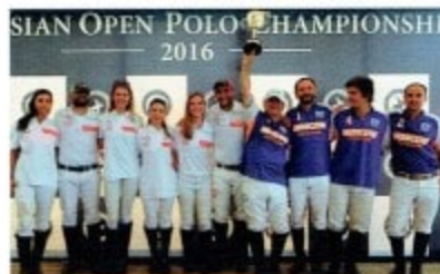
Церемония вручения призов.