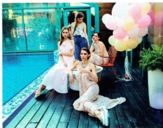
Показ мультибрендового магазина российских дизайнеров Bridge.

Закрытая вечеринка в Майами? Нет, 30 июня на крыше премиум-фитнес-клуба Sky Club звезд, представителей светской и бизнес-элиты столицы собрало на закрытый коктейль событийное агентство TOTCHAS. Завораживающие DJ-сеты и пламенные бармен-шоу, перформансы модных художников создали фон, на котором гости демонстрировали свой лазурный загар и блистали новинками из круизных коллекций. Особого уюта и шарма вечеру добавили официальный интерьерный партнер салон Crate&Barrel и студия стилистов Wow Brow.